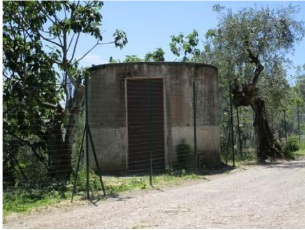
Foto effettuata per l'aggiornamento della scheda a seguito di ratifica con Delibera del C.C. n. 18 del 22/4/2013