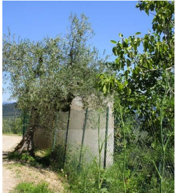
Foto effettuata per l'aggiornamento della scheda a seguito di ratifica con Delibera del C.C. n. 18 del 22/4/2013